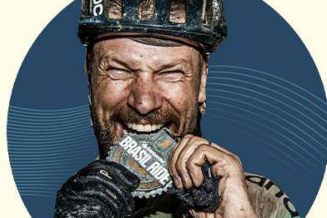
RODRIGO HILBERT APRESENTADOR E CICLISTA