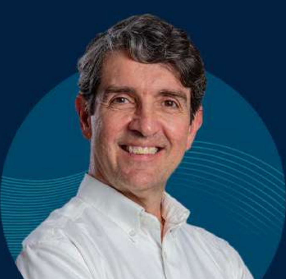
LANCHA JUNIOR NUTRICIONISTA